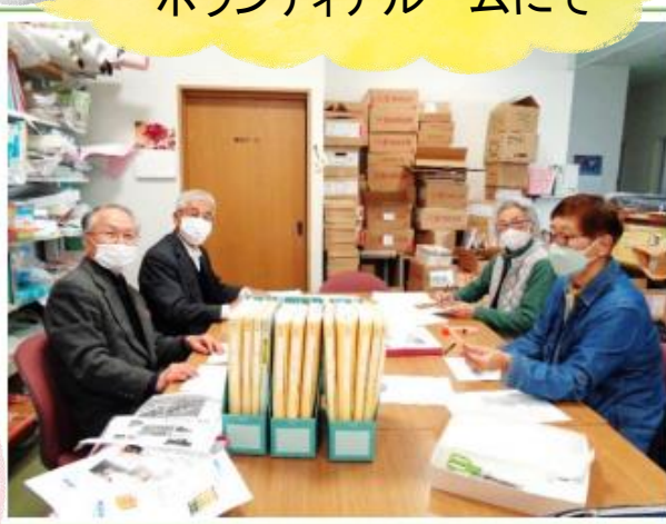
新聞記事グループの皆様