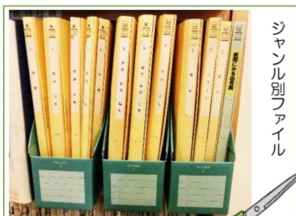
ジャンル別ファイル

新聞記事グループは、発行された新聞記事の中から、射水市に関連する記事をジャンル別にスクラップして頂いています。