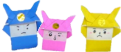
おりがみ (兜 武士)

「絵本屋さん大賞」とは全国書店員がおすすめしたい絵本30冊のことです。ぜひ、読んでみてください。