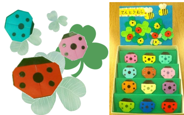
おりがみ (てんとうむし)