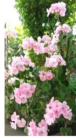
写真(ゼラニウム) 図書館利用者様より