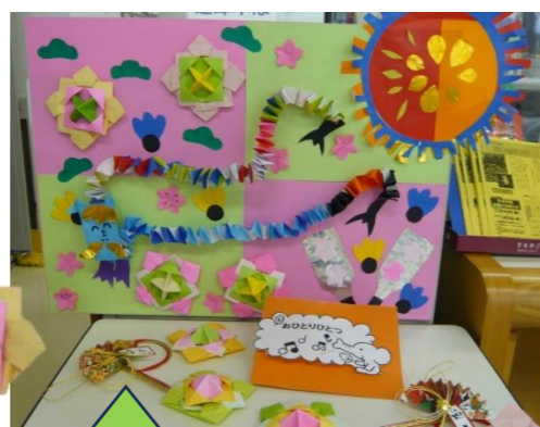
1月のおりがみ (三色こま)

正力図書館では、「寒さに負けるな 免疫力アップ！」をテーマに本を展示貸し出ししています。ご来館をお待ちしていますね。