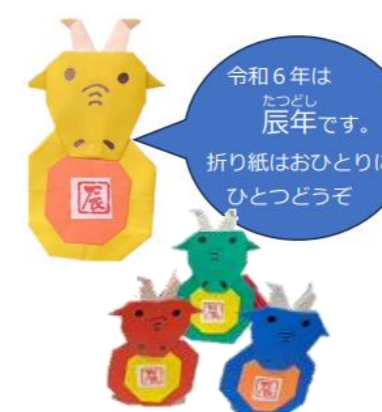
えとだるま 辰 (折り紙)